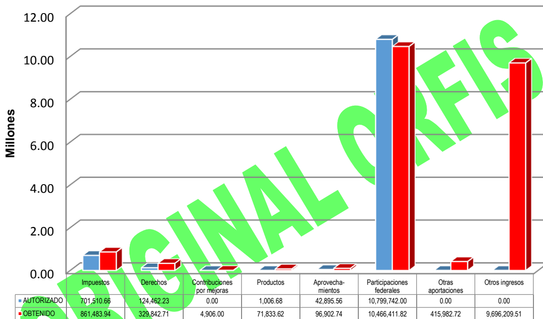
GRÁFICA 1 INGRESOS

Otras aportaciones: Bursatilización $169,982.72, Aportación de Beneficiarios $246,000.00.